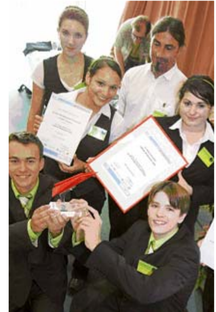
Übungsfirmen & Juniorfirmen