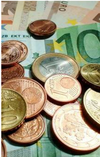
Startklar fürs Geld