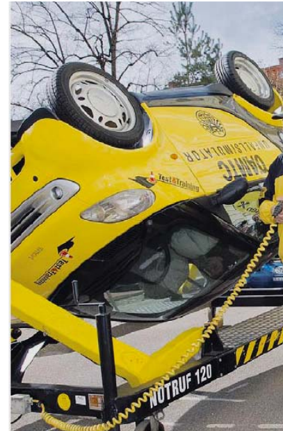
mobil & sicher